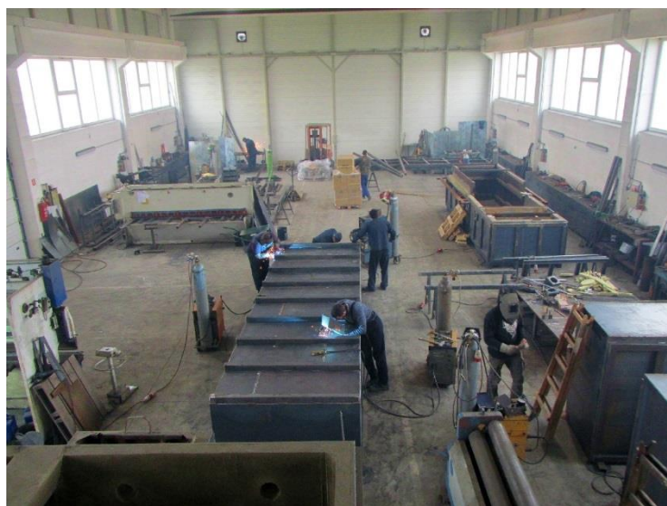
Abbildung 1 Neu Halle / Industriegebiet im Prelog