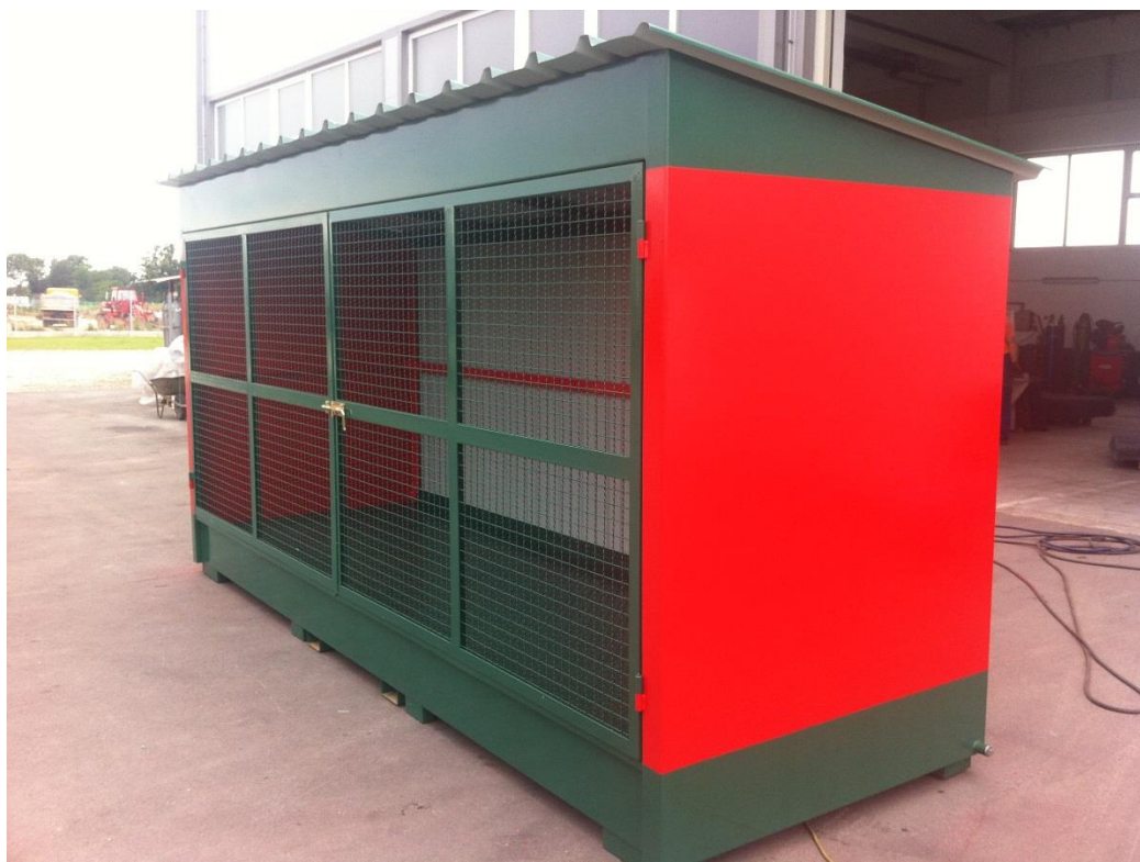
Slika 3: Skladište opasnog otpada

Ostvarili smo suradnju s brojnim domaćim renomiranim tvrtkama kao npr. : Grad Prelog, PREKOM, ŠESTAN BUSCH, HILDING-CROATIA, JEDINSTVO, FEROKOTAO i mnoge druge.