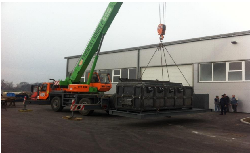
Slika 2 Spalionica otpada / za INCINER 8

Godišnje proizvodimo do 50 spalionica zavisno od tipa i veličine.